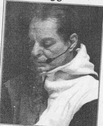
Assegnato a Enzo Moscato il premio Annibale Ruccello

POSITANO (bruno ayone) - Assegnato a Enzo Moscato il premio Annibale Ruccello. Il riconoscimento dedicato al grande drammaturgo scomparso nel 1986, viene istituito quest'anno nell'ambito della "Settimana nel Teatro Italia-